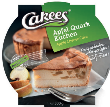
Apfel Quark Kuchen