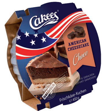
American Choco Cheesecake