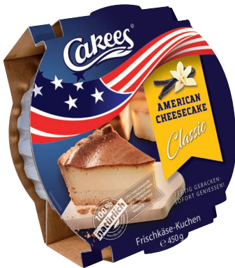
American Classic Cheesecake