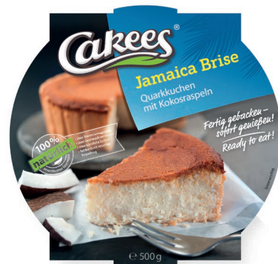
Quarkkuchen mit Kokos