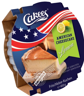
American Lemon Cheesecake